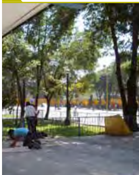
CCH Azcapotzalco (1971)

El proyecto del Colegio de Ciencias y Humanidades fue aprobado por el Consejo Universitario de la UNAM el 26 de enero de 1971, durante el rectorado del Dr. Pablo González Casanova.