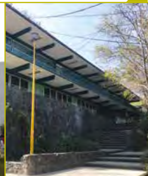
CCH Sur (1972)