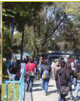
CCH Vallejo (1971)