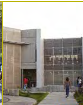
CCH Oriente (1972)