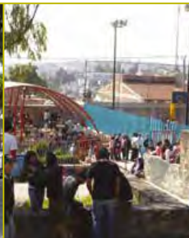
CCH Naucalpan (1971)